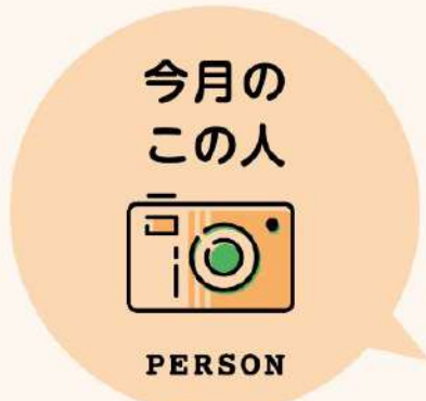
2A 野田光子様 (86歳) いつも周りを助けてくださる、優しい野田さんです！